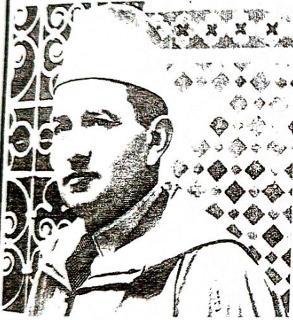
محمد بن يوسف سلطان المغرب (1927-1961)